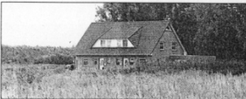
Auch während der Bauphase ist noch vieles möglich.

unseren Kunden durch. Dort, wo Änderungen gewünscht sind, klappt das oft und dann auch ohne Aufpreis - sofern die Wünsche nicht allzu weit von unseren Alternativ-Vorschlägen abweichen.“ Die Einflussnahme kann bis in Details gehen, beispielsweise, wo einmal Steckdosen verlegt werden - oder der antike Schrank von der Erbtante seinen Platz finden soll. Sonderwünsche werden besprochen,