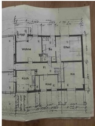
Grundriss Wohnung Stadt.jpg