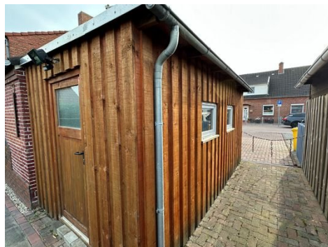
Schuppen / Werkstatt